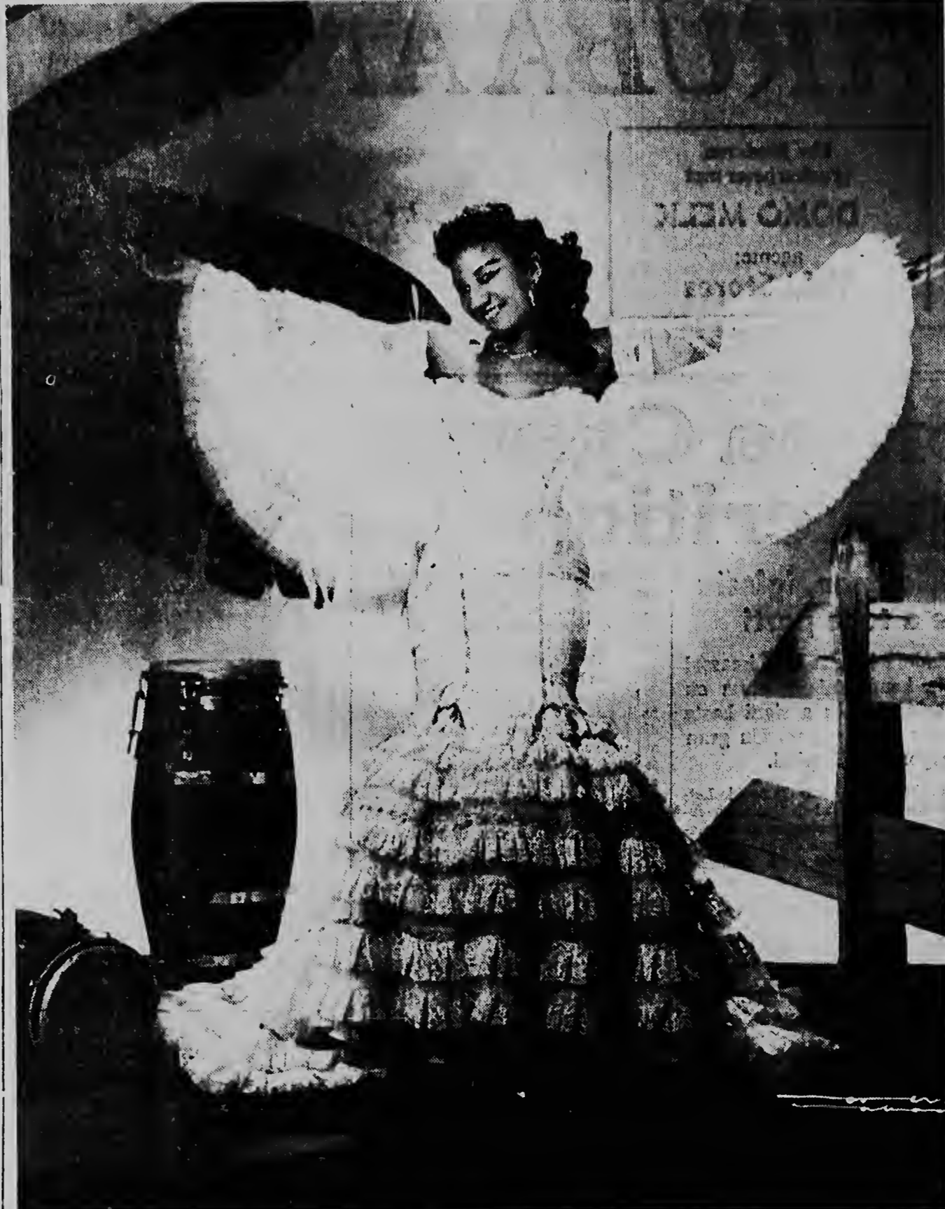
Diabierne ta yega Aruba e cantante consel Celia Cruz. Ariba nos ta mira un di su portretnan recién saca. Celia lo keda aki te Dialuna di unda e lo sigui su viaha pa Cuba. Mientras tanto e lo actua den teatro de Veer y Principal y Diasabra den teatro na Savaneta. Tocante e clubnan na unda e lo canta nos a scribi cuba.